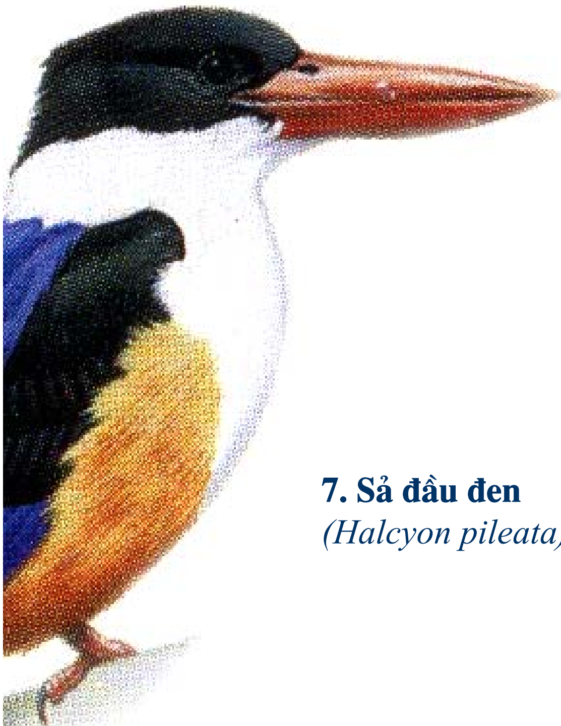
7. Sả đầu đen ( Halcyon pileata )