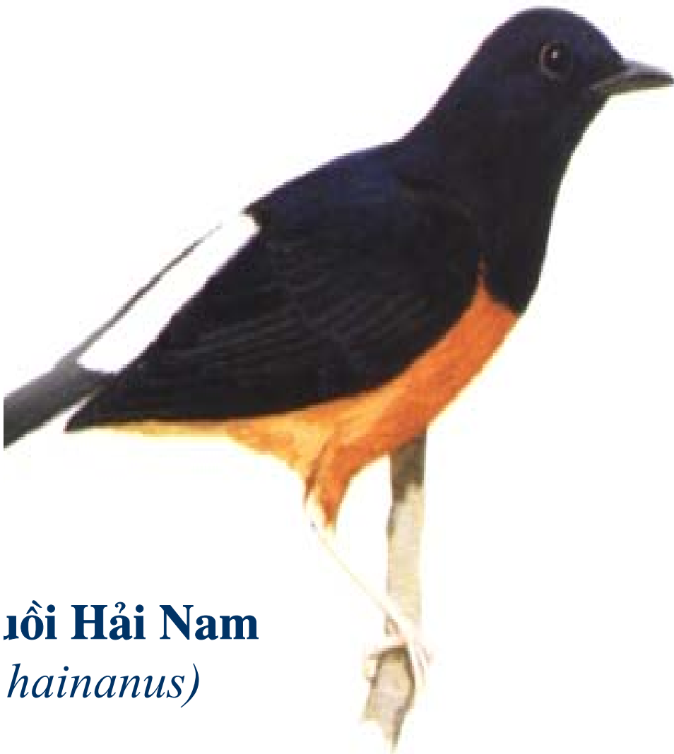
Chim Hải Nam ( hainanus )