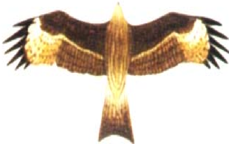
Điểu hâu ( Buteo migrans )