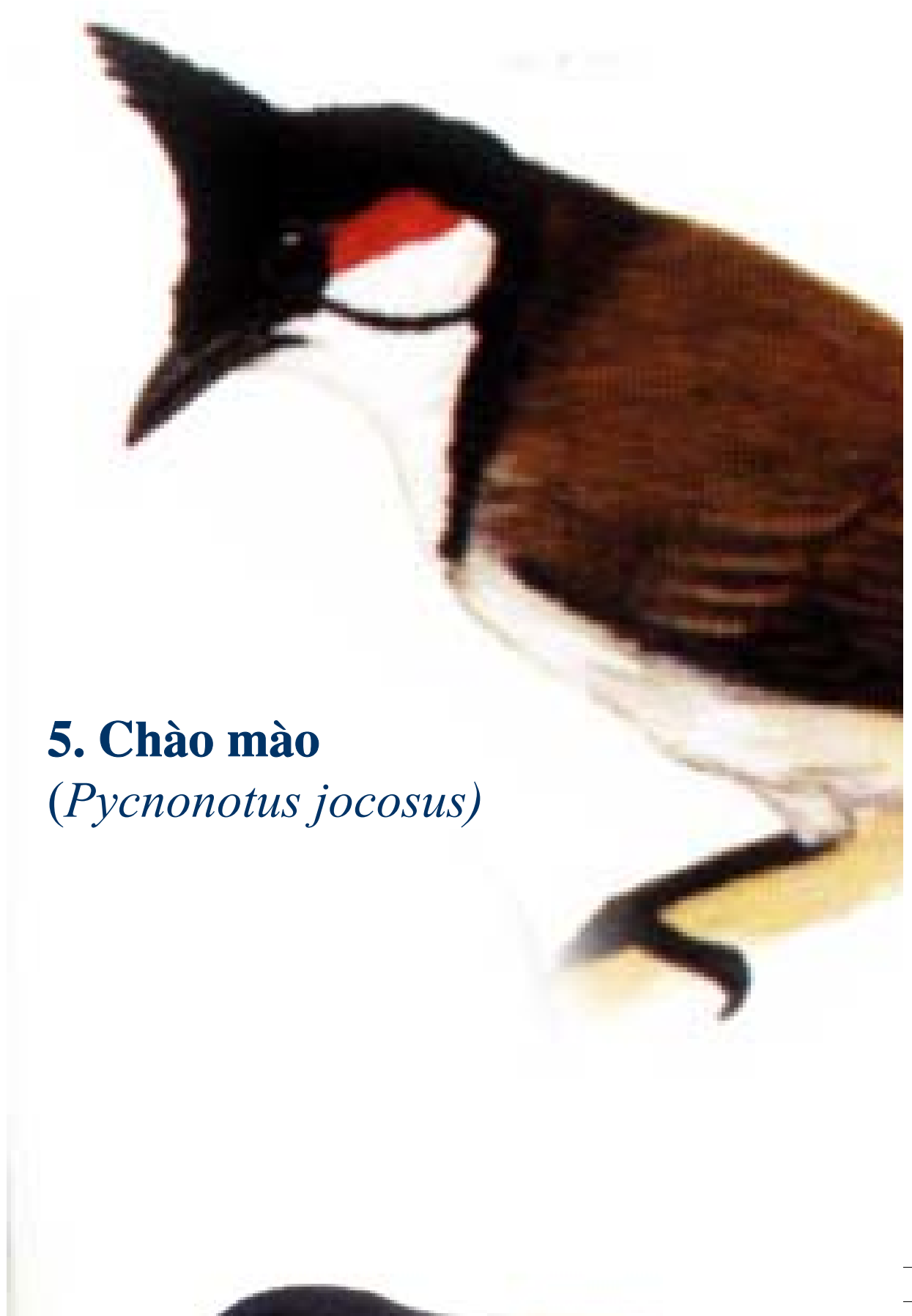
5. Chào mào ( Pycnonotus jocosus )